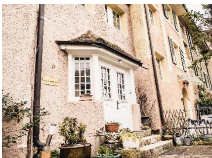
Eingang zur Praxis